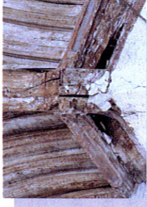
Détail d'une sablière